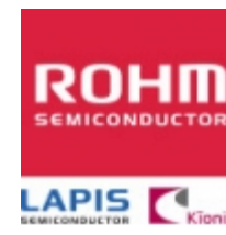
2SAR544P5 ROHM 2SAR544P5 ROHM