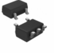
S-1000C42-M5T1U SII Semiconductor Corporation IC VOLT DETECTOR