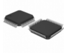
AT89C51CC03CA-RDTUM Microchip Technology IC MCU 8BIT 64KB FLASH 64VQFP