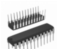
ADM238LAN Analog Devices Inc. IC TXRX QUAD RS-232 5VLP 24DIP