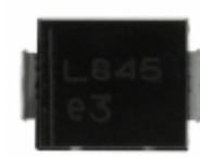
LSM845J Microsemi Corporation DIODE SCHOTTKY 45V 8A DO214AB