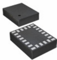
LSM9DS1TR STMicroelectronics IMU ACCEL/GYRO/MAG I2C/SPI 24LGA