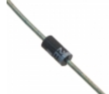
1N4730PE3/TR8 Microsemi Corporation DIODE ZENER 3.9V 1W DO204AL