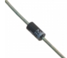
1N4731 G Microsemi Corporation DIODE ZENER 4.3V 1W DO204AL