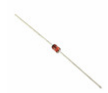
1N4731A AMI Semiconductor / ON Semiconductor DIODE ZENER 4.3V 1W DO41