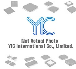
BD46262G ROHMNMX BD46262G ROHMNMX