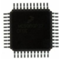
MC908GT16CFBE NXP USA Inc. IC MCU 8BIT 16KB FLASH 44QFP