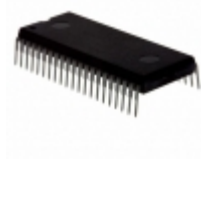
MC908GT16CBE NXP USA Inc. IC MCU 8BIT 16KB FLASH 42PSDIP