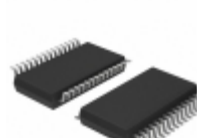
LTC1458CG#PBF ADI (Analog Devices, Inc.) IC D/A CONV 12BIT R-R QUAD28SSOP