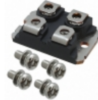
VS-UFB230FA60 Electro-Films (EFI) / Vishay DIODE MODULE 600V 141A SOT227