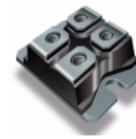
VS-UFB200FA60P Electro-Films (EFI) / Vishay DIODE GEN PURP 600V 126A SOT227