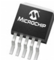
MCP1825T-3302E/ET Microchip Technology IC REG LDO 3.3V 0.5A DDPAK