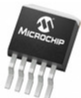
MCP1826-0802E/ET Microchip Technology IC REG LDO 0.8V 1A DDPAK