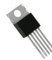
MCP1826-0802E/AT Microchip Technology IC REG LDO 0.8V 1A TO220-5