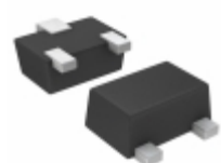
DTD723YMT2L Rohm Semiconductor TRANS PREBIAS NPN 150MW VMT3