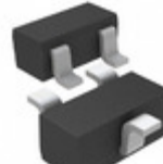
DTD713ZETL Rohm Semiconductor TRANS PREBIAS NPN 150MW EMT3