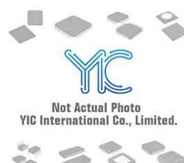
MIC29300-2.5BU MICREL MICREL TO263