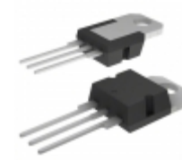
MIC29300-3.3BT Microchip Technology IC REG LDO 3.3V 3A TO220-3