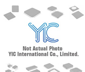
MIC29300-3.3WUTR MIC MIC TO-263