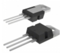
MIC29300-3.3WT Microchip Technology IC REG LDO 3.3V 3A TO220-3