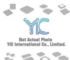
MIC29300-2.5WU MICREL MICREL TO263