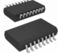
AD724JRZ-R7 Analog Devices Inc. IC ENCODER RGB TO NTSC 16SOIC