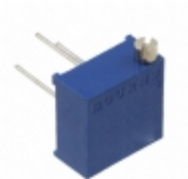
RJ24FW204 Bourns, Inc. TRIMMER 200K OHM 0.5W PC PIN TOP