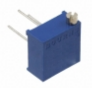
RJ24FW200 Bourns, Inc. TRIMMER 20 OHM 0.5W PC PIN TOP