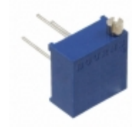
RJ24FW201 Bourns, Inc. TRIMMER 200 OHM 0.5W PC PIN TOP