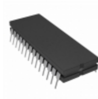
AD7828BQ Analog Devices Inc. IC ADC 8BIT 8CH HS 28-CDIP