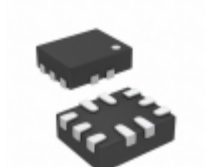
ADG772BCPZ-REEL Analog Devices Inc. IC MUX/DEMUX 2X1 10LFCSP