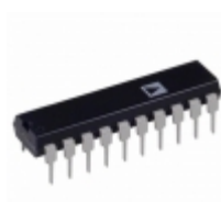
AD7545AKN Analog Devices Inc. IC DAC 12BIT MULTIPLYING 20-DIP