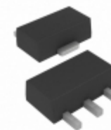
MCP1703AT-2802E/MB Microchip Technology IC REG LDO 2.8V 0.25A SOT89-3