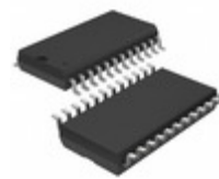
LTC1335ISW#PBF ADI (Analog Devices, Inc.) IC TXRX RS232/485/EIA562 24-SOIC