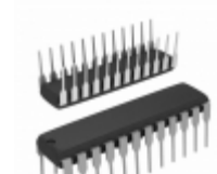
LTC1335IN#PBF Linear Technology IC TXRX RS232/RS485/EIA562 24DIP