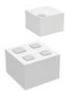
BD3150N50100AHF Anaren XFRMR BALUN RF 3100-5000MHZ 0404