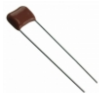
ECQ-E2223JF Panasonic Electronic Components CAP FILM 0.022UF 5% 250VDC RAD