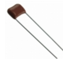
ECQ-E2223JF9 Panasonic Electronic Components CAP FILM 0.022UF 5% 250VDC RAD