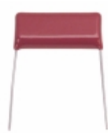
ECQ-E2185KS Panasonic Electronic Components CAP FILM 1.8UF 10% 250VDC RADIAL