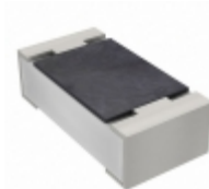
RC0603JR-07360RL Yageo RES SMD 360 OHM 5% 1/10W 0603