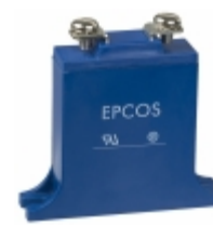
B40K320 EPCOS (TDK) VARISTOR 510V 40KA CHASSIS