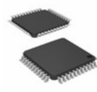
PIC16F19175-I/PT Micrel / Microchip Technology 14KB FLASH, 1KB RAM, 256KB EE, L