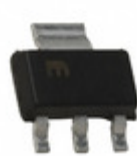
MIC5239-3.0YS-TR Microchip Technology IC REG LDO 3V 0.5A SOT223