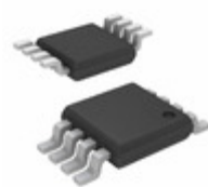
MIC5239-3.15BMM-TR Microchip Technology IC REG LDO 3.15V 0.5A 8MSOP