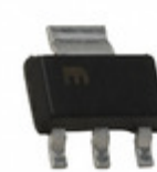
MIC5239-3.15BS TR Microchip Technology IC REG LDO 3.15V 0.5A SOT223