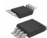
MIC5239-3.15BMM Microchip Technology IC REG LDO 3.15V 0.5A 8MSOP