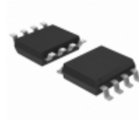
MIC5239-3.15BM-TR Microchip Technology IC REG LDO 3.15V 0.5A 8SOIC