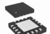
SY88912LMI Microchip Technology IC LASR DRVR 3.2GBPS 3.45V 16MLF