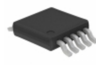
SY88913VKC-TR Microchip Technology IC AMP LIMITING POST HS 10-MSOP