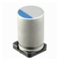
337UVR6R3MEF Illinois Capacitor CAP ALUM POLY 330UF 20% 6.3V SMD