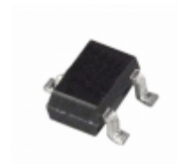
ADM1810-5AKSZ-RL7 Analog Devices Inc. IC MONITOR RESET 4.62V SC-70-3