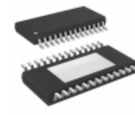
A3940KLPTTR-T Allegro MicroSystems, LLC IC CTRL MOSFET FULL 28TSSOP