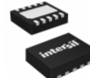
ISL54222AIRTZ-T Intersil IC MULTIPLEXER DUAL 2X1 10TDFN