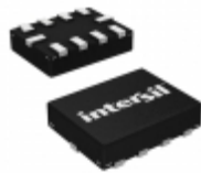
ISL54221IRUZ-T Intersil IC USB SWITCH DUAL SPDT 10UTQFN