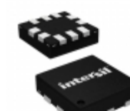
ISL54220IRUZ-T Intersil IC USB SWITCH DUAL SPDT 10UTQFN