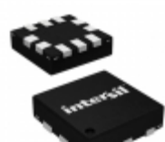
ISL54222AIRUZ-T Intersil IC MULTIPLEXER DUAL 2X1 10UFQFN