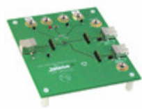
ISL54220IRUEVAL1Z Intersil EVALUATION BOARD FOR ISL54220