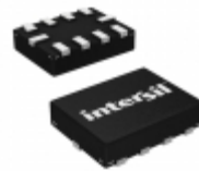
ISL54222AIRU1Z-T Intersil IC MULTIPLEXER DUAL 2X1 10UFQFN