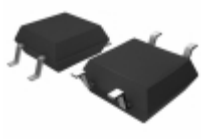
BU4938F-TR Rohm Semiconductor IC VOLT DETECTOR STD 4-SOP