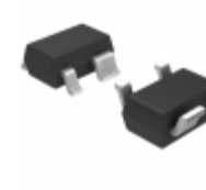
S-80920CNNB-G8QT2G SII Semiconductor Corporation IC VOLT DETECTOR 2.0V SC-82AB