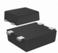
S-80920CLPF-G6QTFU SII Semiconductor Corporation IC VOLT DETECTOR 2.0V SNT-4A