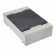
RC0805JR-074R7L Yageo RES SMD 4.7 OHM 5% 1/8W 0805