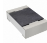
RC0805JR-074M3L Yageo RES SMD 4.3M OHM 5% 1/8W 0805