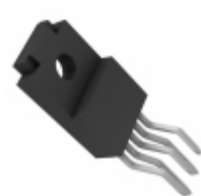
BA033ST-V5 Rohm Semiconductor IC REG LDO 3.3V 1A TO220FP-5