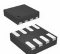
ADA4692-2ACPZ-RL Analog Devices Inc. IC OPAMP VFB 3.6MHZ RRO 8LFCSP