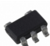
MIC5225-2.7YM5-TR Microchip Technology IC REG LDO 2.7V 0.15A SOT23-5