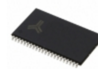
AS7C34098A-20TCN Alliance Memory, Inc. IC SRAM 4MBIT 20NS 44TSOP