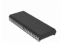
AS7C34098A-20JCNTR Alliance Memory, Inc. IC SRAM 4MBIT 20NS 44SOJ