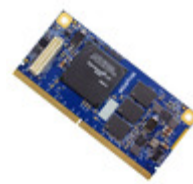
5CSX-H5-4YA-RI Critical Link MITYSOM-5CSX W/ ALTERA CYCLONE V