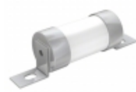
OSD100M160 Eaton FUSE CRTRDGE 160A 415VAC CYLINDR