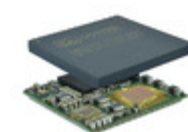
OSD3358-512M-BSM Octavo Systems 21MM 256 BALL BGA