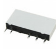
APF30209 Panasonic Electric Works RELAY GENERAL PURPOSE SPDT 6A 9V