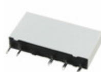
APF30212 Panasonic Electric Works RELAY GEN PURPOSE SPDT 6A 12V