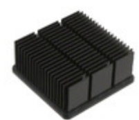
APF30-30-13CB CTS Electronic Components HEATSINK LOW-PROFILE FORGED