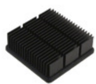
APF30-30-10CB/A01 CTS Electronic Components HEATSINK FORGED W/ADHESIVE TAPE