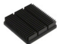
APF30-30-06CB/A01 CTS Electronic Components HEATSINK FORGED W/ADHESIVE TAPE