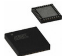
AT97SC3205-G3M4200B Microchip Technology PRODSTD COM SPI TPM 4X4 32VQFN