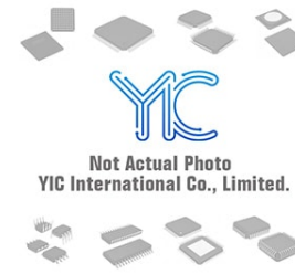
US6T9 TR ROHM US6T9 TR ROHM