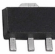
BCX6925E6327HTSA1 Infineon Technologies TRANS PNP 20V 1A SOT-89