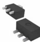
BCX6916TA Diodes Incorporated TRANS PNP 20V 1A SOT-89