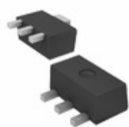
BCX6925TA Diodes Incorporated TRANS PNP 20V 1A SOT89