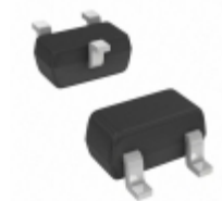
BZX84C11T-7-F Diodes Incorporated DIODE ZENER 11V 150MW SOT523