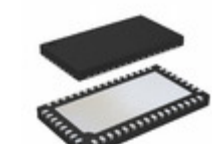
LTC6950IUHH#PBF ADI (Analog Devices, Inc.) IC FREQ SYNTH PLL 48QFN