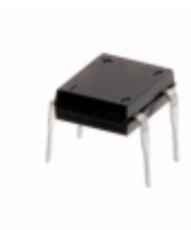
B80C800DM-E3/45 Electro-Films (EFI) / Vishay DIODE BRIDGE 0.9A 125V 6DIP