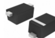
BAT54XV2T1H ON Semiconductor DIODE SCHOTTKY 30V SOD523-2