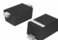
BAT54XV2T1G ON Semiconductor DIODE SCHOTTKY 30V 200MA SOD523