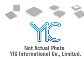
MCC250-16IO1B IGBT Module IGBT Modules