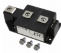
MCC250-18IO1 IXYS THYRISTOR DUAL 1800V 450A