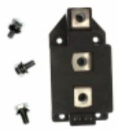
MCC250-14IO1 IXYS THYRISTOR DUAL 1400V 450A