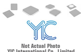
MCC250-14io8 IXYS IGBT Modules