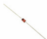
1N4736A AMI Semiconductor / ON Semiconductor DIODE ZENER 6.8V 1W DO41