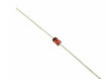
1N4736A Fairchild/ON Semiconductor DIODE ZENER 6.8V 1W DO41