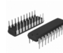
ATF16V8B-15PU Microchip Technology IC PLD 8MC 15NS 20DIP